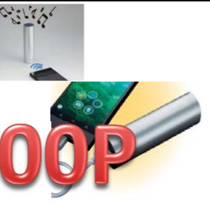
申込NO.10-04 ブルートゥース スピーカー&モバイルバッテリー 4000mAh USBコード