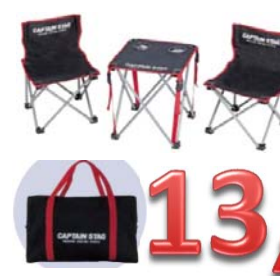
申込NO.13-03 キャプテンスタッグ コンパクトテーブル& チェア 収納バック付