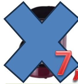
申込NO.07-03 ラノ コーヒーメーカー 5カップ・600ml・950g