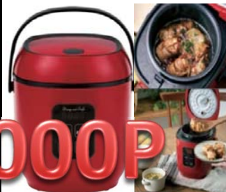
申込NO.13-02 D&C コンパクトライス& フードクッカー レシピブック付き