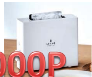
申込NO.15-02 レトルト亭 レトルト調理器 ガスも水もラップもいらない!