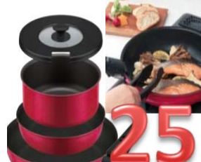
申込NO.25-01 サーモス 取っ手の取れるフライパン ガス・オープン・IH・食洗器対応