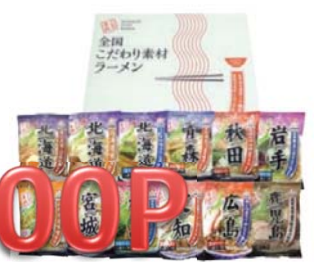
申込NO.07-04 全国こだわり素材 ラーメン12食(乾麺)