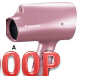
申込NO.25-02 パナソニック ヘアードライヤー ナノケア ナノイー搭載・1200W