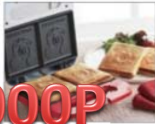
申込NO.10-02 ミッキーマウス ホットサンドメーカー